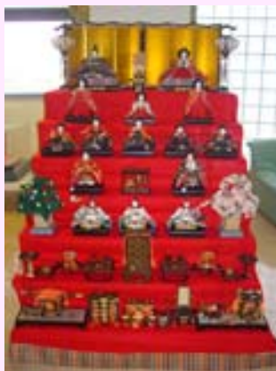
つくしんぼ長尾の玄関ホール