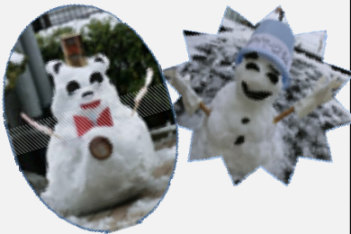
【デイサービスセンター長尾】

業務において入居者様、職員が笑って過せるような雰囲気作り、環境作りを心掛けております。業務上の課題は沢山ありますが、自己研鑽に励みます。職員全体のスキルアップを図り、入居者様に「たんぽぽ藤阪で生活して良かった。」と喜ばれるよう努力してまいります。