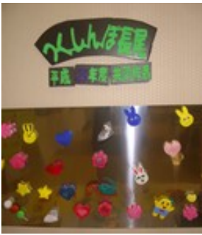
(マグネット付き粘土細工) 【入居者様と共同作品】